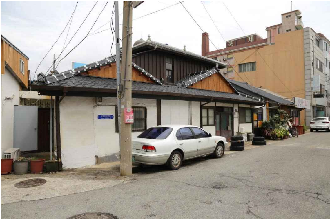
이리장 여관_오 | 관