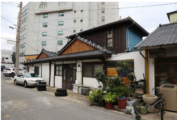
이리장 여관 외관

본 건물은 대지면적 66㎡, 연면적 38.68㎡, 건축면적 28.76㎡, 지상 2층 건물이다. 건물의 위치는 목포역 북쪽 도로 모서리의 교차로에 남북으로 대지에 맞추어 건축물이 배치되어 있다. 주 출입구는 도로 쪽에 두었다. 현재 건축물은 시멘트 기단 위에 기초부를 구성, 목재 창호와 시멘트 뿔철로 벽체를 마감, 지붕은 검은색 기와 형태의 컬러강판을 올렸다.