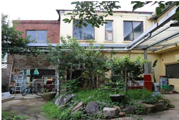
강수의 여관 내부 전면