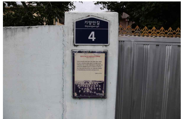
강수의 여관 건물 안내판