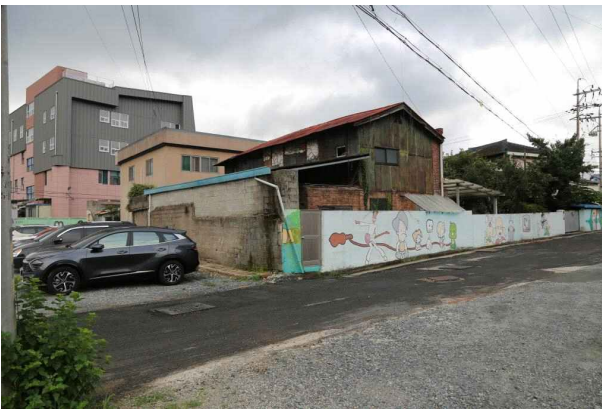
강수의 여관 외관

장흥 지방 ‘향토사학연구’에서 제작한 건물 안내 정보에 의하면 “이곳은 1935년경 신축한 일본식 여관 건물로 상호는 태양여관이였다. 1945년 장흥읍 행원 2구 잣두 마을에 위치한 ‘장흥농잠실수학교’교사였던 벽돌을 활용하여 건물 외벽을 고쳐 1946년도에 ‘장흥경찰서내 감무서’가 운영되기도 하였으며, ‘백양사진관과 예식장’으로 그리고 장흥 최초의 양재학원인 ‘백양양재학원’을 1970년대까지 운영하였던 곳이다.”라고 기록되어 있다.