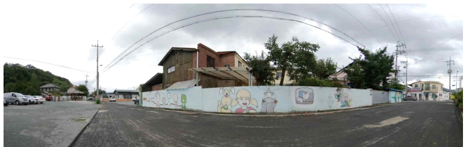
강수의 여관 파노라마

본 건물이 있는 기양리 인근은 일명 칠거리로 불리던 곳이다. 동교 다리를 중심으로 시냇바늘 방향으로 세기 시작하여 읍사무소 옆 신흥 가는 길까지 일곱 개의 길이 있어 이름하여 칠거리라고 불려왔다. 1979년 현재 터미널로 옮겨져 장흥 중심 시가지로 변모하기 전까지 장흥의 대표적인 상업과 소통의 중심지였다. 서쪽으로는 광주지방법원 장흥지원, 장흥읍사무소 남쪽으로는 장흥 토요시장이 위치한 곳이다.