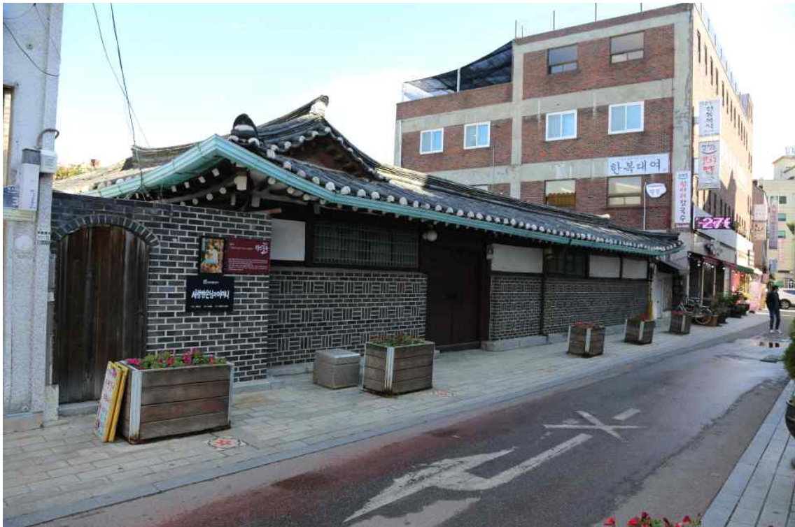
장 병 익 가 옥