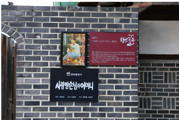
장병익가옥_과거 영화 안내판